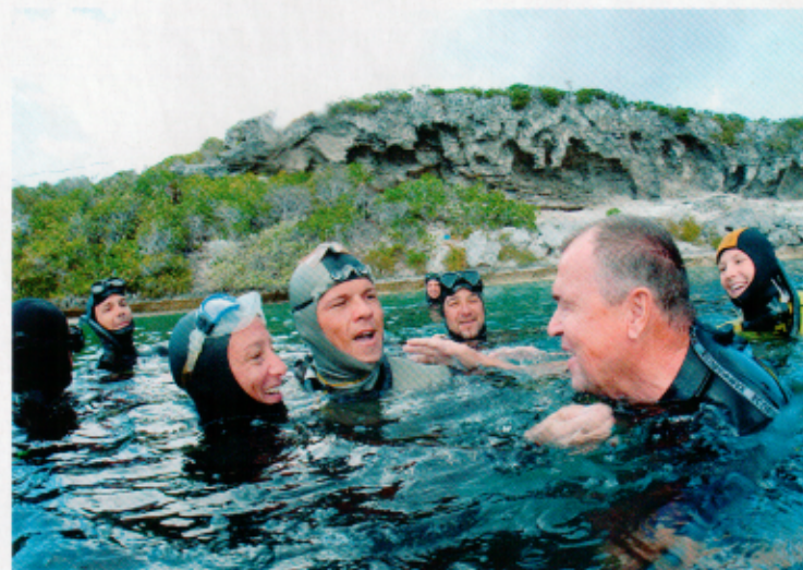
Herbert Nitsch après son fabuleux record.

William Trubridge et son équipe ont obtenu l'organisation des championnats du monde individuel Aida 2009. Nul doute qu'en novembre, le Blue hole et ses conditions propices aux performances exceptionnelles seront, une fois de plus, le théâtre de l'affrontement des titans de l'apnée. +