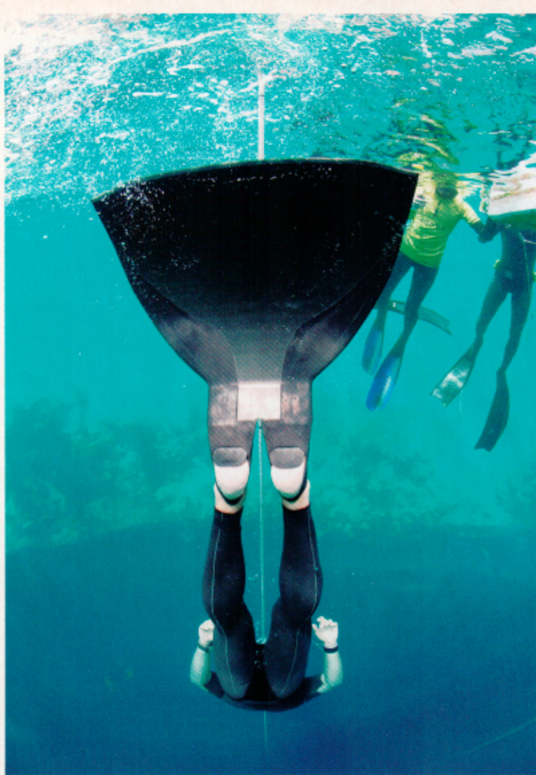
Herbert Nitsch a battu le record de Guillaume Néry.