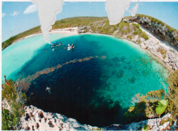
Une piscine naturelle aux Bahamas.