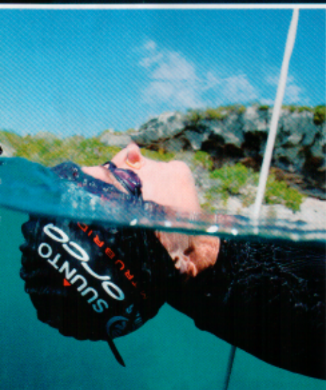
William Trubridge était l'organisateur de la compétition.

Une sécurité sans faille pour chacune des plongées.