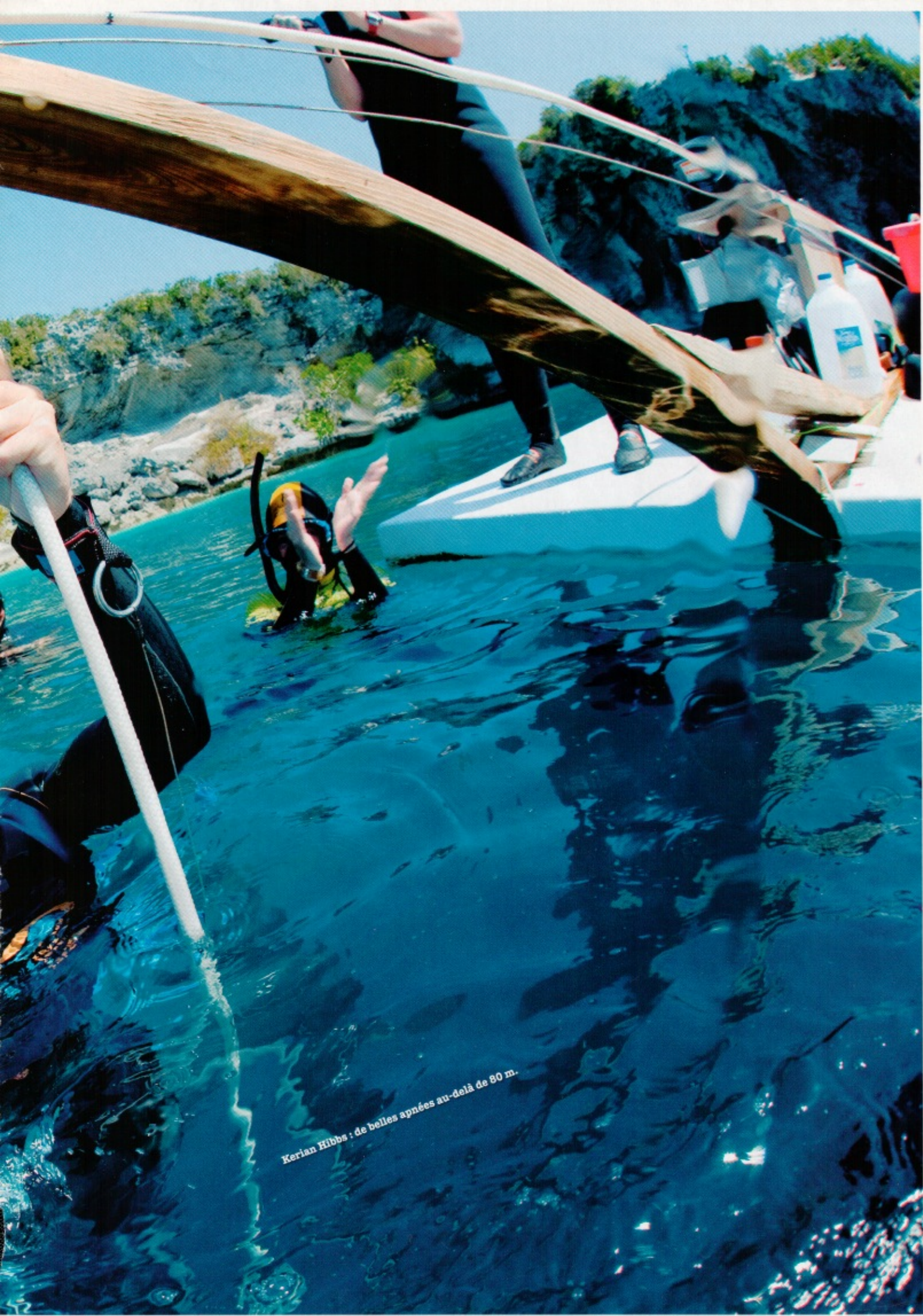
Kerian Hibbs : de belles apnées au-delà de 80 m.