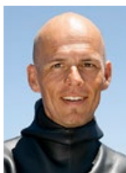
HERBERT NITSCH L'Autrichien de 44 ans, ancien pilote de ligne, est détenteur de 31 records du monde dans différentes disciplines de l'apnée.

La jambe droite lui joue encore des tours. Il doit anticiper chacun de ses pas pour ne pas tomber. Bientôt, il marchera comme avant, il le pense sincèrement. De sa voix grave et encore un peu maladroite, Herbert Nitsch tente de remonter le fil de sa mémoire. Il y a deux ans, dans la baie de Santorin, en Grèce, le détenteur du record du monde de descente en apnée (214 mètres, en juin 2007) a tutoyé la mort lors d'une plongée en no limit , l'épreuve la plus spectaculaire, la plus fantasmagique et la plus dangereuse de la discipline : un accident de décompression ( lire page suivante ) survenu alors qu'il venait de défier les abysses en mer Égée. Détenteur de 31 records entre 2001 et 2010 dans les huit catégories techniques que recense l'Aida, l'Association internationale pour le développement de l'apnée, et véritable patron des profondeurs, Herbert Nitsch caressait un projet fou : plonger à 800 pieds (244 mètres), puis à 900 puis à 1 000 ; et être le premier – probablement le dernier aussi – à s'enfoncer à 300 mètres sans bouteilles.