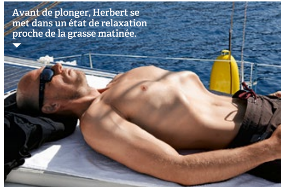
Avant de plonger, Herbert se met dans un état de relaxation proche de la grasse matinée.

et Jacques Mayol, les deux héros du Grand Bleu , entraîne les plongeurs vers le fond. Le compte à rebours lancé, les plongeurs de secours sont envoyés vers le fond. Ébullition. Lunettes collées au visage, pince-nez chaussé, figé dans son jouet pour adultes qui le plongera à la vitesse de 3 mètres par seconde vers les profondeurs, Nitsch s'emplit les poumons, happe tout ce qu'il peut encore de l'air de la Grèce par des petits mouvements