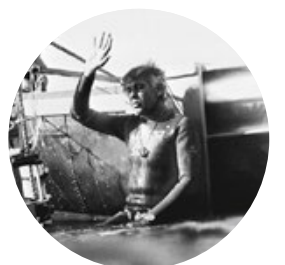
JACQUES MAYOL (ET ENZO MAIORCA) LES PIONNIERS

Dans les années 1990, « Pipin » et l'Italien Umberto Pelizzari battent tour à tour le record du monde en apnée no limit . Le Cubain descendra le plus bas, à 170 mètres, en 2000.